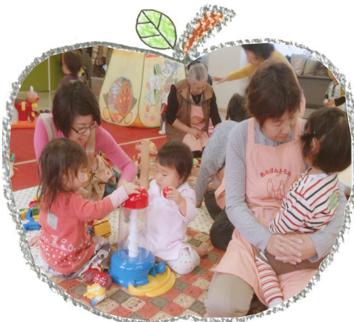
< ボランティアさんも奮闘中!! >

ママ達が頑張っているころ別室の子供達は泣き疲れて眠る子、ママと別れた不安からボランティアさんにくっついてはなれない子、おもちゃとお手伝いの人の話術にひきこまれ楽しく遊んでいる子などさまざま。