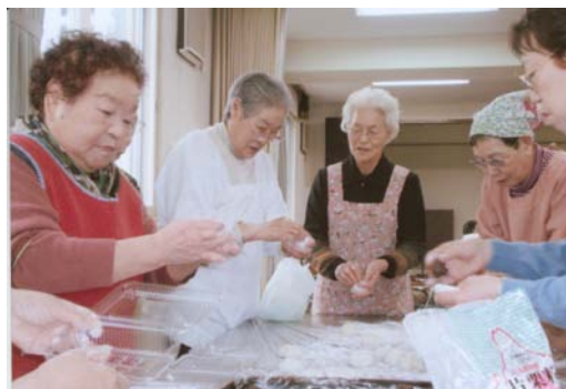
<昔とった きねづか>