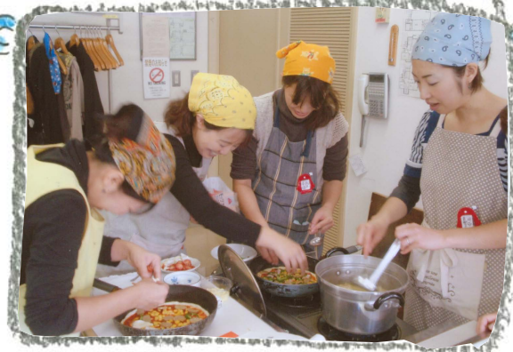
< ただいま奮闘中!! >

子供をボランティアさんに預け、少しの間ママ達だけで過ごした時間はリフレッシュできたでしょうか？