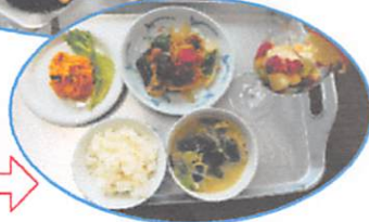
完成した料理です

「子育て中のお母さんに一時でも料理に集中してもらい、レパートリーを広げてもらおう」との思いから、託児付きの料理教室を年一回開催しています。