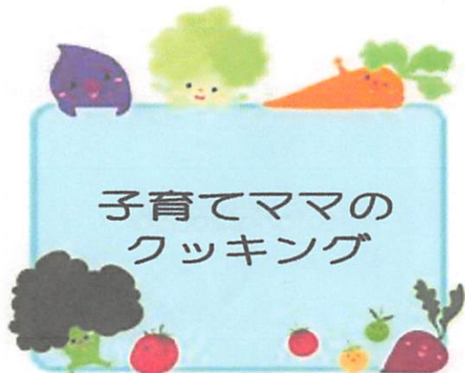
11月27日(水) 月寒公民館料理室& 第3研修室