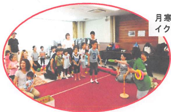
月寒公民館でのイクメンの様子

また、10月10日(木)には南月寒小学校ミニ児童会館でのさろんが開催され、かわいいおサルさんのボードビル「アイアイ」や3匹のこぶたの手遊びなどをみんなで楽しみました。ママたち向けに、区の保健師さんによる骨密度測定もありました。