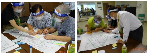
マップ作り(三区・月羊会)