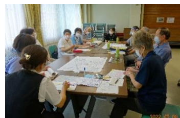
グループでの情報交換