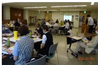
区社協からのお話

グループに分かれてからの情報交換では、町内会の未加入者への対応の難しさや、ボランティアのなり手が減少していることへの不安などをお話する方が多くいらっしゃいました。